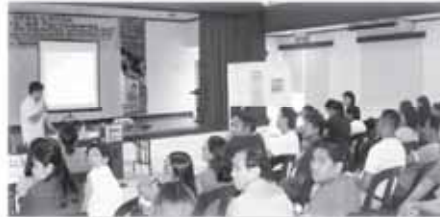
City Social Worker and Development Office Disaster Response Team Seminar