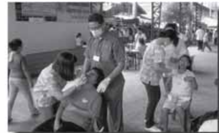
Medical Mission and Housing Project sa Bgy. Bignay