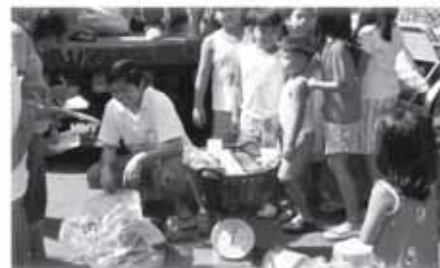
Inspeksyon ng mga timbangan sa public market

Si Aling Prosy ay isa lamang sa mga maraming mamamayan, mga estudyante, mga manggagawa at marami pa, na nasisiyahang maglakad sa mga bagong gawang sidewalk.