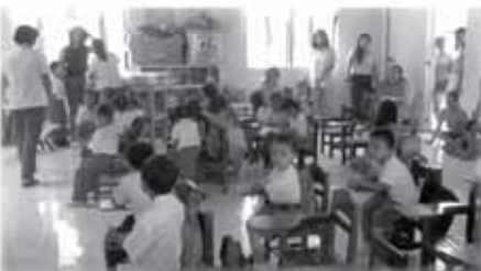
Early childhood care program for ages 3-6 y.o.