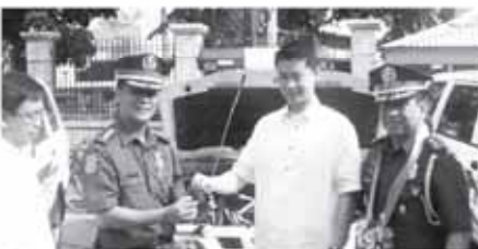
Tatlo pang bagong Crosswind Isuzu vehicle ibinigay ng Pamunuan ni Mayor WIN sa PNP Valenzuela