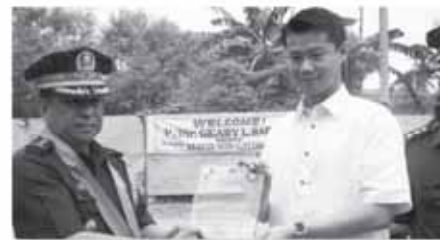
Mayor WIN naggawad ng plaque ng pagkilala at pasasalamat kay Gen. Barias