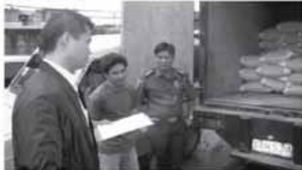
Mayor WIN at PiSupt. Idio inspecting illegally rebagged NFA rice

170 bags well-milled Grade #4 Super NFA Rice were discovered and being diverted into a small makeshift warehouse inside Rafols Compound in