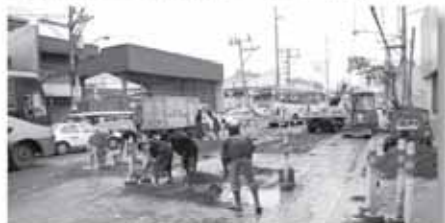
Inaayos ang kalsada sa paanan ng Tullahan Bridge