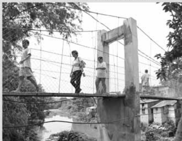
Ang bagong kawayan bridge na dumudugtong sa Brgy. Ugong, Valenzuela City at Brgy. Talipapa, Caloocan City

Halos kasing haba din nito ang kalapit na Kawayan hanging bridge na pinasinayaan kamakailan.