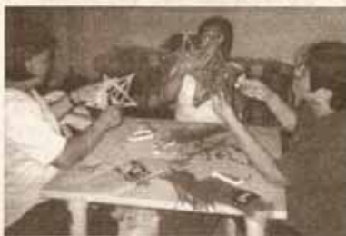
"HANDMADE" PAROL NGAYONG PASKO Gumagawa ng parol na yari sa straw ang mga kasapi ng WIN Mother's Club bilang pagbahanda sa nalalapit na kapaskuhan na maaaring pagmulan ng kita para sa pamilya o panregalo kaya sa mga kakilala.