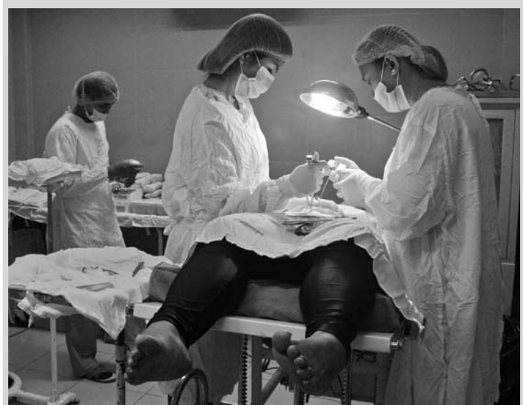
HINDI NA MASUSUNDAN. Tegno sa loob ng Marulas Lying-in Clinic habang isinasagawa ang BTL o "pagtatali" sa isang pasyente.

Kadalasang nauwi sa pagdialysis ang kaso ng mga sakit sa bato na hindi kaagad nalalaman at naaagapan. Isa hanggang dalawang sesyon kada linggo ang dapat binuoin ng mga nag-he-hemodialysis