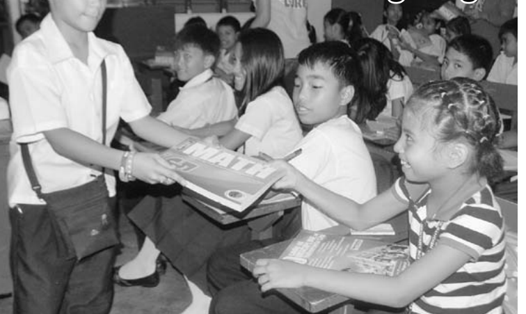
EDUCATIONAL SUPPLEMENT. Nag-volunteer ang isang estudyante ng San Miguel Heights Elementary School sa Brgy. Marulas na tumulong sa pagpapamahagi ng Math at English worktext sa kanyang mga kamag-aral.