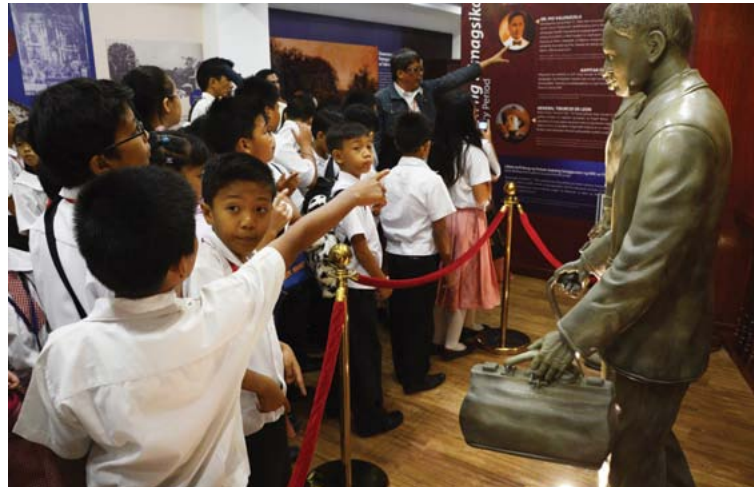
MGA BAYANI NG HIMAGSIKAN. Nakaharap ng mga estudyante ng Philippine Ling Lian Christian School ang life-size sculptures nina Gen. Tiburcio de Leon, Dr. Pio Valenzuela at Kap. Delfin Veilla, mga bayaning Valenzuelano noong Himagsikan.