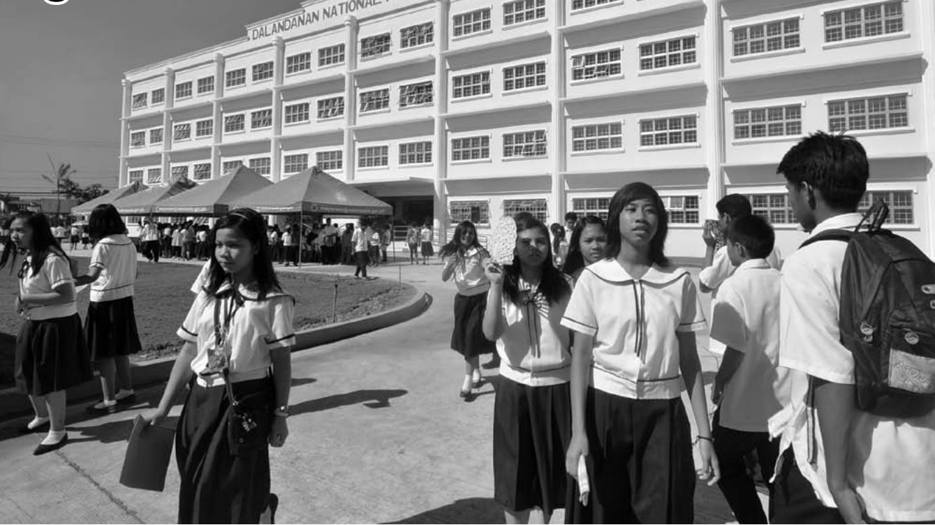
GANADO NA, INSPIRED PA. Ganado ang mga mag-aaral ng Dalandanan NHS sa kanilang pag-aaral dahil sa nakaka-inspire na bagong gusali ng paaralan at mga bagong klasrum.

PINASINAYAAN NG MGA OPISYAL , kasama ang mga mag-aaral ang bagong gusali ng Dalandanan National High School (DNHS) kasabay ang pagbubukas ng Engineering Building sa Pamantasan ng Lungsod ng Valenzuela (PLV) kamakailan.