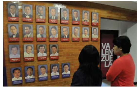
MGA LIDER NG BAYAN. Nakatanghal din sa VCM ang larawan ng mga dating punong lungsod at kinatawan sa Kongreso. M. Cayabyab

"The museum was built to create a sense of affinity and connection to our beloved constituents," wika ni Gatchalian. Sa pamamahala ng