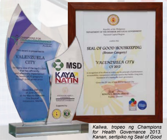
Kaliwa, trofeo ng Champions for Health Governance 2013. Kanan, sertipiko ng Seal of Good Housekeeping mula sa DILG.