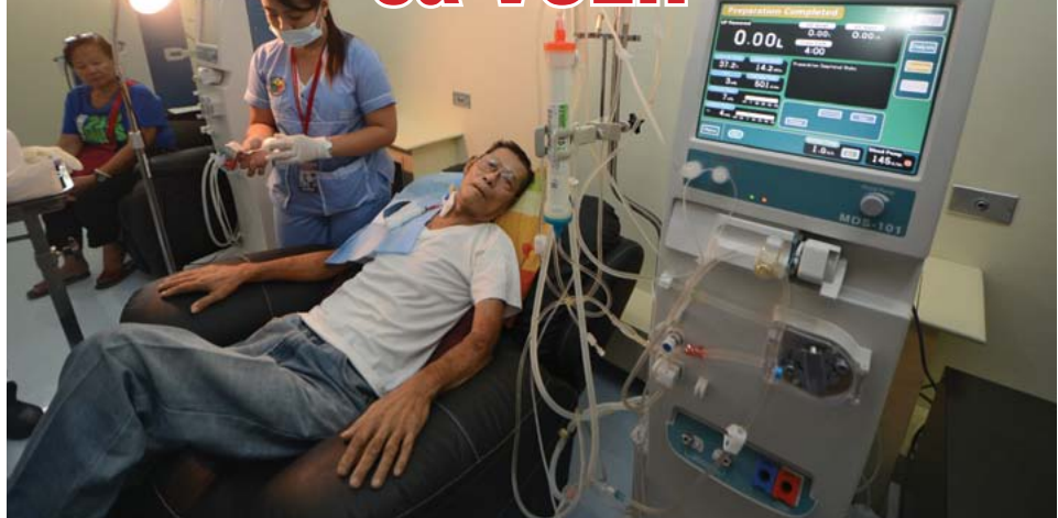
BUDGET-FRIENDLY. Komportableng sumasailalim sa kanyang hemodialysis session ang isang pasyente ng dialysis center sa VCEH. Kung ikukumpara sa ibang dialysis clinic, mas mura ang presyo dito ng bawat session.

BUKAS NA UPANG MAGSERBISYO SA MGA NANGANGAILANGAN ang bagong dialysis center ng Valenzuela City Emergency Hospital.