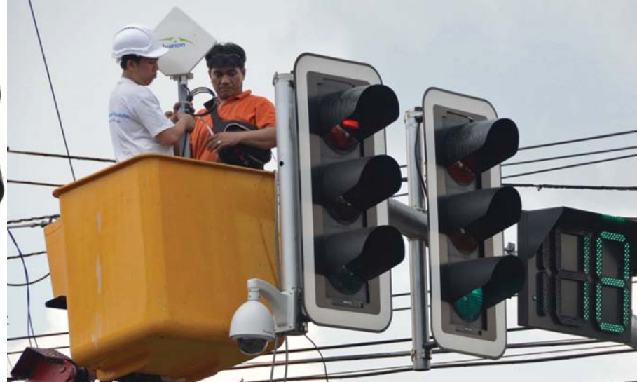
Ang pagkakabit ng CCTV camera sa kanto ng MacArthur Highway at Cecilio Santos Street sa Brgy. Karuhatan. Malaking tulong ang mga teknolohiyang ito sa pagpapanatili ng kaligtasan at kapayapaan sa lungsod.