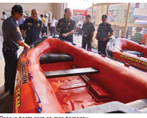
Rescue boats para sa mga barangay.