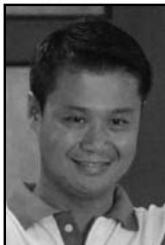
Unang Distrito Hon. Sherwin T. Gatchalian