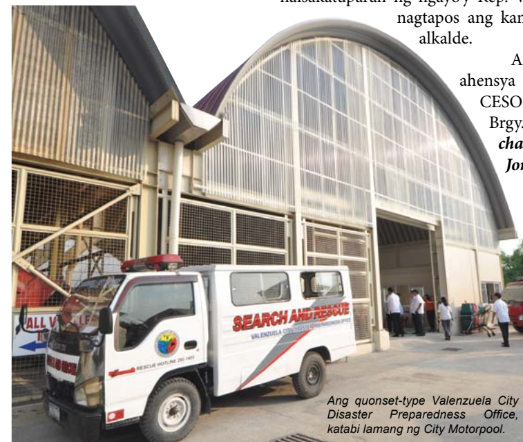
Ang quonset-type Valenzuela City Disaster Preparedness Office, katabi lamang ng City Motorpool.