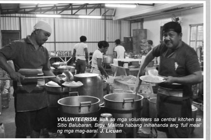
VOLUNTEERISM. Ila sa mga volunteers sa central kitchen sa Sitio Balubaran, Brgy. Malinta habang inihahanda ang 'full meal' ng mga mag-aaral. J. Licuan

Sinimulan ang pagpapakain sa mga bata nitong Agosto at ipagpapatuloy sa loob ng 136 na araw para sa elementarya at 120 araw naman para sa day care. - Beng Bautista