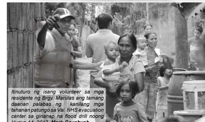
Ilinuturo ng isang volunteer sa mga residente ng Brgy. Marulas ang tamang daanan palabas ng kanilang mga tahanan patungo sa Val. NHS evacuation center sa ginanap na flood drill noong Hunyo 14, 2013. Mark Cayabyab