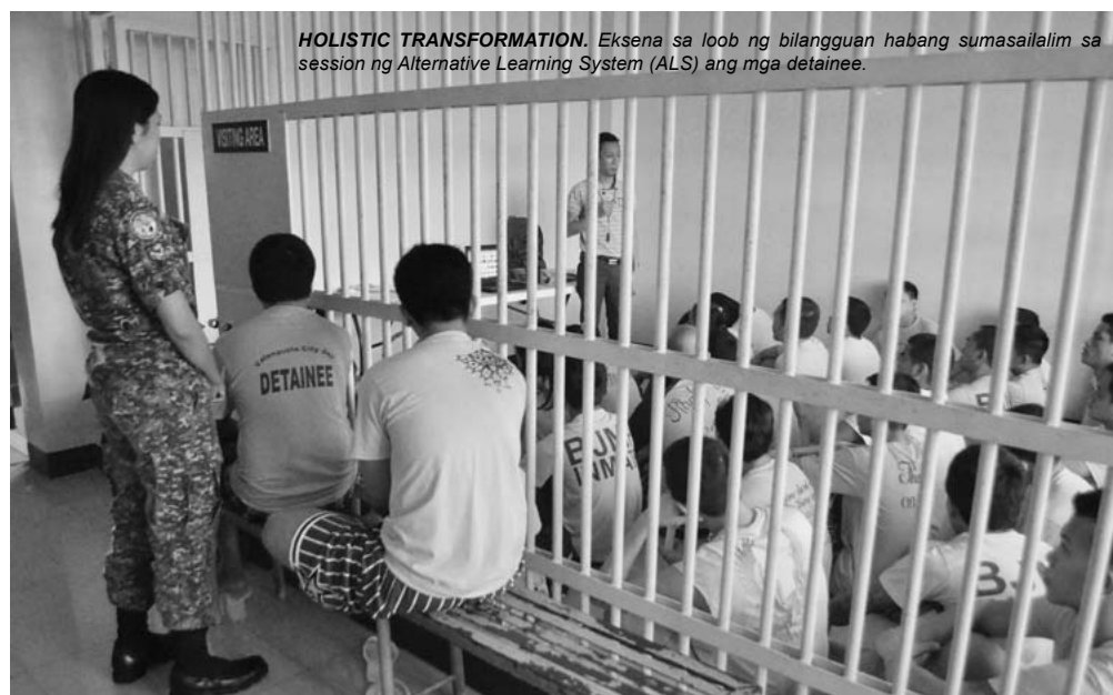
HOLISTIC TRANSFORMATION. Eksena sa loob ng bilanguan habang sumasalim sa session ng Alternative Learning System (ALS) ang mga detainee.

MAAYOS NA PANAHANAN AT MAKATAONG REHABILITASYON ang hatid ng bagong Valenzuela City Jail na pormal na binuksan noong Hunyo 24 sa ilalim ng pamamahala ng dating alkalde at ngayoy District 1 Rep. Sherwin T. Gatchalian. Matatagpuan sa Maysan Road, Brgy. Malinta katabi ng Bulwagang Katarungan, ang gusali ay mayroong limang palapag at may laking 1,900 metro kwadrado na nagtataglay ng labindalawang selda, visiting area, maayos na mga banyo, klinika at mini-canteen, habang ang sun deck ay ginawang basketball court para sa pisikal na mga aktibidad ng mga inmate. Sa kasalukuyan, ito ay nagsisilbing tahanan sa mahigit 500 preso. Mas presko at maaliwalas ang bagong pasilidad