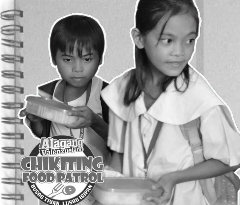
Alagang Valenzuelano CHIKITING FOOD PATROL LUSOG TIYAN, LUSOG ISIPAN