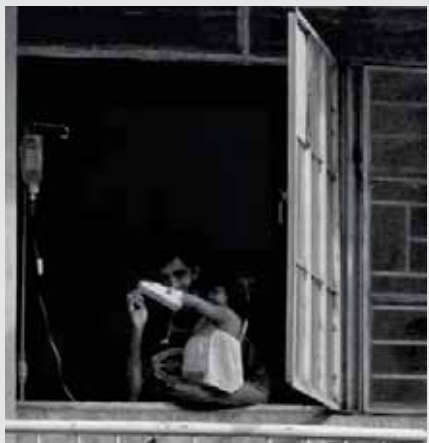
Nakadungaw ang mag-amang ito sa Valenzuela City Emergency Hospital sa Brgy. Poblacion na nakatakdang palitan ng isang mas maayos na pasilidad.

Saklaw ang mga proyektong ito sa ilalim ng "social governance" category ng Valenzuela City Government na kamakailan lamang ay bukod tanging binigyan ng perfect score na