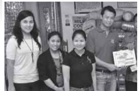
2- Sa isang mas maaliwalas at kumportableng tanggapan na pinagsisilbihan ng mga kawani ang mga kliyente ng frontline services gaya ng City Social Welfare and Development Office (CSWDO, sa larawan) at Public Employment Service Office (PESO) para sa mas maayos na pagbibigay serbisyo.