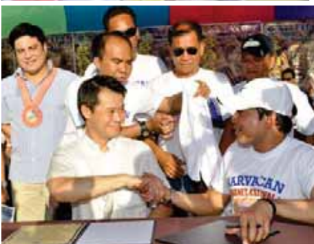
Nagkamayan sina Mayor WIN Gatchalian at Narvacan Mayor Zuriel Zaragoza matapos lagdaan ang sisterhood agreement ng dalawang lider.