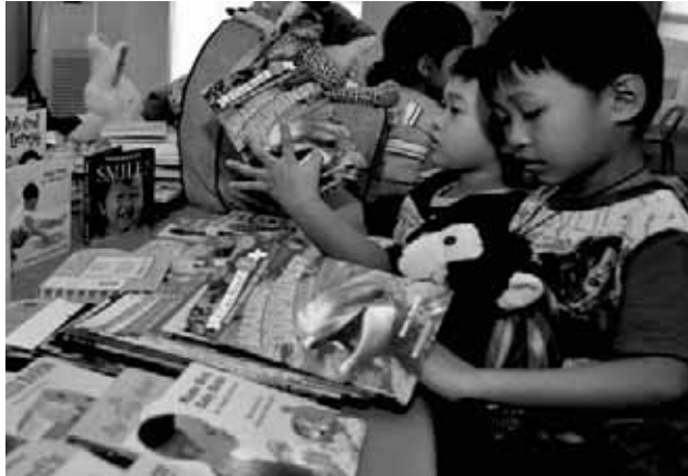
Tila isang quality check ang isinasagawa ng mga paslit na ito sa mga bagong aklat at laruan ipinagkaloob sa kanilang day care center ng Rotary Club of Valenzuela West at Rotary Club of Kerrville, Texas, USA.

Sa kasalukuyan, mayroong tatlong iba pang day care center ang tinatapos para magamit ng kanilang pamayanan. Ito ay ang Sitio Kabatuhan Day Care Center sa Brgy.