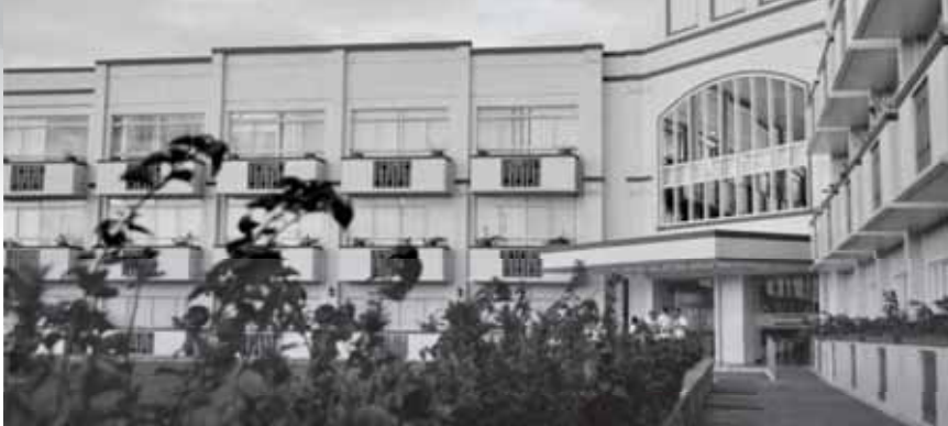
Ang katatapos na People's Center and Legislative Building na nakadikit sa Executive Building ng City Hall.

Bahagi ito ng proyekto sa Valenzuela City Police Capability Enhancement Program ng pamahalaang lokal upang itaas ang moral ng kapulisan at mapalakas pa ang kanilang kapasidad na rumesponde sa pagpapatupad ng batas at pagpapanatili ng kaayusan sa lungsod.