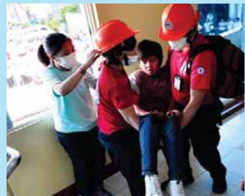
Bahagi ang Philippine Red Cross sa emergency preparedness program ng lungsod kung saan regular ang isinasagawang mga training, gaya ng fire drill na ito sa Pamantasan ng Lungsod ng Valenzuela. FILE PHOTO