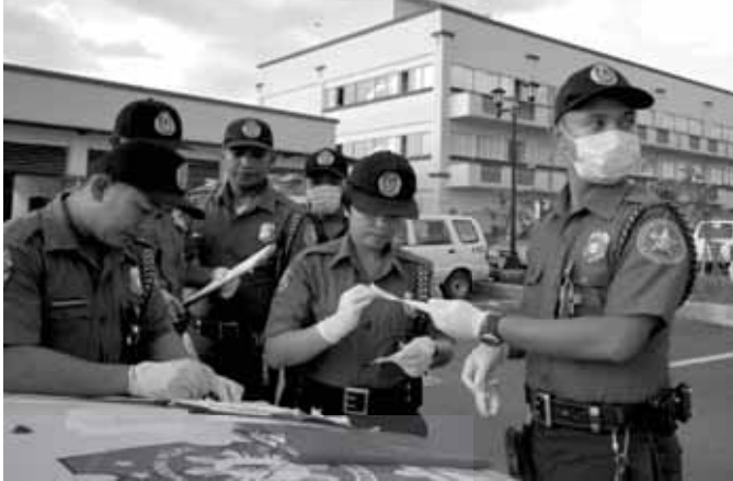
Abala ang mga pulis na ito sa kanilang crime scene investigation and evidence documentation training na isinagawa sa likod ng bagong Valenzuela City Police Station. Bukas ang Valenzuela City Police sa mga nais mag-apply maging pulis.

NILATAG ANG RED CARPET AT PORMAL na pinasinayaan ng Pamahalaang Lungsod ng Valenzuela ang makabagong Legislative and People's Center Building at ang City Police Station na kapwa matatagpuan sa New City Government Complex sa Brgy. Karuhatan, sa kahabaan ng Mac Arthur Highway. Isinagawa ang pagpapasinaya noong Nob. 9, kasabay ng pagdiriwang ng ika-390 taon ng pagkakatatag ng Valenzuela City bilang maliit na bayan ng Polo.