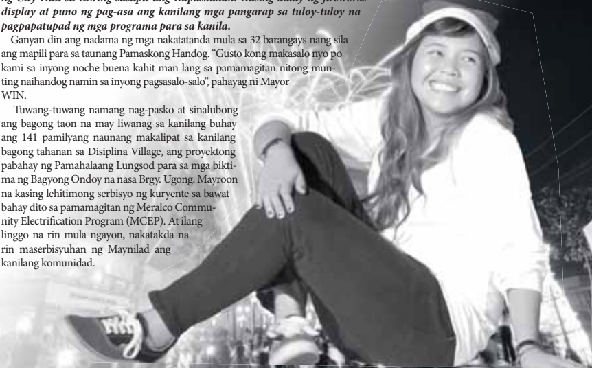
Buong giiliw ang estudyanteng ito sa production number ng kanilang eskwelahan noong Tree of Hope lighting ceremony.

Tuwang-tuwang namang nag-pasko at sinalubong ang bagong taon na may liwanag sa kanilang buhay ang 141 pamilyang naunang makalipat sa kanilang bagong tahanan sa Disiplina Village, ang proyektong pabahay ng Pamahalaang Lungsod para sa mga biktima ng Bagyong Ondoy na nasa Brgy. Ugong, Mayroon na kasing lehitimong serbisyo ng kuryente sa bawat bahay dito sa pamamagitan ng Meralco Community Electrification Program (MCEP). At ilang linggo na rin mula ngayon, nakatakdang rin maserbisuhan ng Maynilad ang kanilang komunidad.