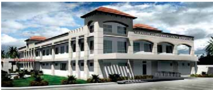
Base sa architect's perspective ng bagong ospital, ganito ang magiging hitsura ng bagong primary hospital na may 50-bed capacity.