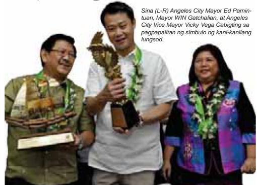
Sina (L-R) Angeles City Mayor Ed Pamintuan, Mayor WIN Gatchalian, at Angeles City Vice Mayor Vicky Vega Cabigting sa pagpapalitan ng simbolo ng kani-kanilang lungsod.

Layon ng sisterhood agreement sa pagitan ng mga local government units ang magkaroon ng daan tungo sa makabuluhang pagpapalitan ng mga natatanging kasanayan. "Mahalaga na matuto tayo sa ating mga kasama, ganun din na maibahagi natin ang ating nalalaman kung paano natin naabot ang ating kinalalagan ngayon," saad ni Mayor WIN. "Ang taumbayan din ang makiabang sa huli," pagtatapos niya.