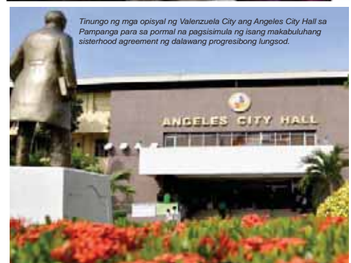
Tinungo ng mga opisyal ng Valenzuela City ang Angeles City Hall sa Pampanga para sa pormal na pagsisimula ng isang makabuluhang sisterhood agreement ng dalawang progresibong lungsod.