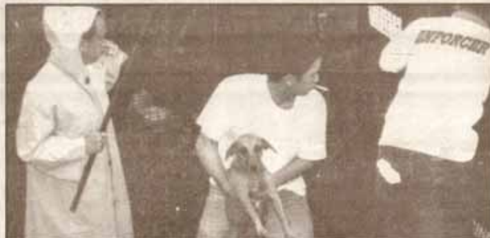
ABALANG-ABALA ang mga tauhan ng City Agriculture Office sa panghuli ng mga asong gala bilang pagpapalakas sa Animal Control Program ng lungsod. Makikita rin sa kabilang larawan ang City Pound ng siyudad na matatagpuan sa Barangay Marulas.

Sa pangyayaring ito, malaki ang tiwala ng Pamahalaang Panlungsod ng Valenzuela na ang target na 300 na hayop kada buwan ay bababa sanhi ng ginagawang paghigpit sa implementasyon ng programa at patuloy na kumpanya hinggil dito.