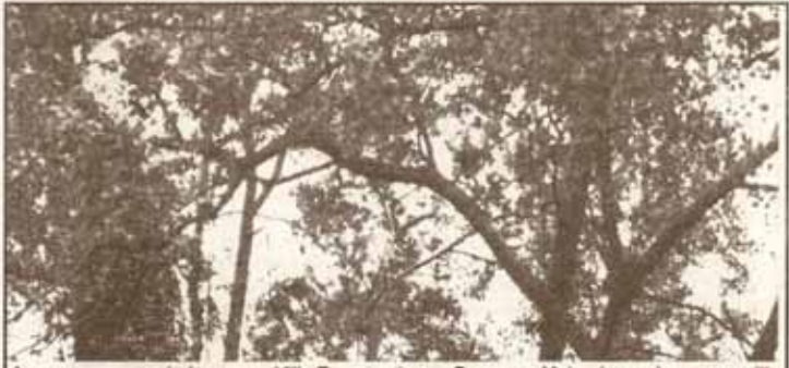
Ang mga puno ng bakawan sa Villa Encarnacion sa Barangay Malanday na kung saan dito naninirahan ang mga Bakaw-Gabi.

gayundin ang pagbibigay kaalaman sa mga tao ukol sa maaaring idulot ng pagkaubos ng mga kakaibang uri ng ibong ito sa kabuuang sistemang pangkapaligiran o eco-system. Naglabas na ng kautusan ang Punong Lungsod sa