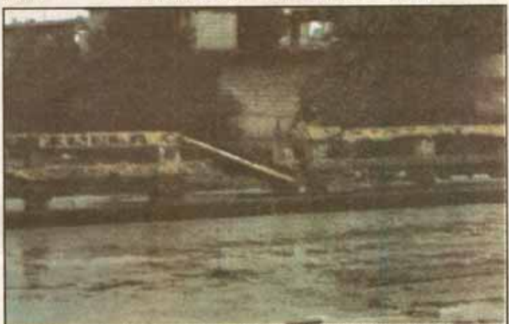
ITO ang estado ngayon ng Tullahan Bridge, na kung saan nangangailangan ng dagliang paggawa.

dumadaloy sa ilog ay naiipon sa ilalim ng tulay at nagdudulot ng pagbaha.