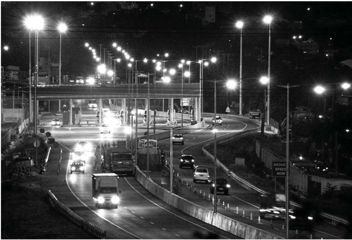
Ang NLEX Mindanao Ave. toll plaza sa Brgy. Ugong

Ang Segment 9 na magsisimula sa cloverleaf interchange ng Segment 8.1 ay hahagip sa mga