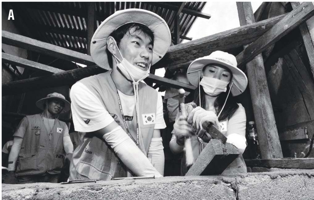
Abala ang mga Korean college student na ito para sa isang housing and community building project.