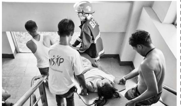
Ang prevention and awareness dissemination program tulad nitong fire drill na isinagawa sa Pamantasan ng Lungsod ng Valenzuela ay mahalaga para sa kapakanan ng mga estudyante at mga empleyado.

Source: www.prc.org.ph Valenzuela City Rescue Unit Tel. No.: 292-1405 Red Cross Valenzuela Chapter Tel. No.: 432-0273