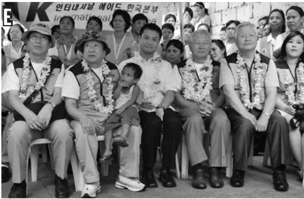
(D-E) Pag-ibig at pasasalamat sa mga Pilipino hatid ng International Aid Korea.