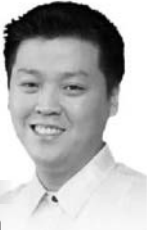
Rep. Rex Gatchalian Unang Distrito, Valenzuela City

kat walang mag-iisip na gumawa ng krimen dahil sa alam ng bawat isa na mayroon silang mga bahay na matitirahan at pagkaing maihahain sa mesa.