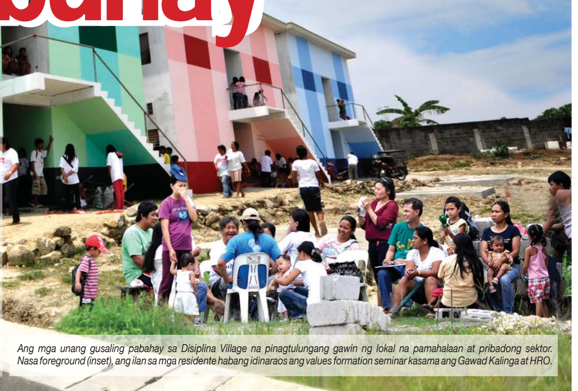
Ang mga unang gusaling pabahay sa Disiplina Village na pinagtutulungang gawin ng lokal na pamahalaan at pribadong sektor. Nasa foreground (inset), ang ilan sa mga residente habang idinaraos ang values formation seminar kasama ang Gawad Kalinga at HRO.