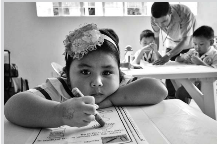
Abala ang mga mag-aaral sa isang daycare center sa GK Manolo Village, Brgy. Dalandanan. Nagsisilbing tahanan ng daycare center ang Rotary Sibol bldg. na naipatayo ng Rotary Club of Valenzuela bilang tulong sa ECCD program ng lungsod.