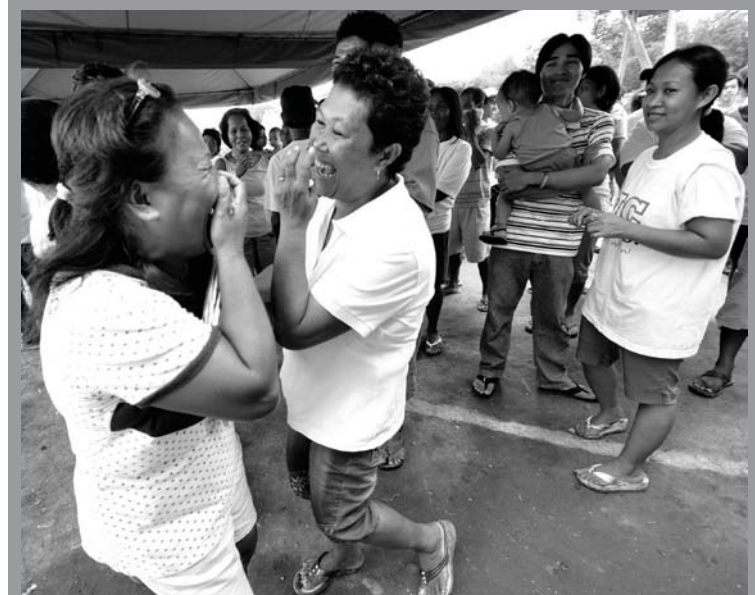
Sa lingguhang values formation seminar, layon nitong mapalapat at mapatatag ang samahan ng mga residente dito.

Ayon sa Human Development Report ng World Food Programme, ang Pilipinas ay kabilang sa mga bansang may seryosong antas ng malnutrisyon. May 28% ng mga kabataang Pilipino ang kulang sa timbang at 18% ng kabuuang populasyon ay hindi nakakakain ng sapat.